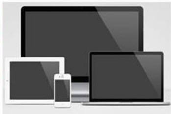
平板手机电脑维修