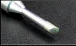
马蹄头; 沾锡性能好, 长寿命

特点: 用烙铁头前端斜面部份进行焊接, 适合需要多锡量之焊接。故此沾锡量会与C型烙铁头有所不同, 视焊接之需要而选择。应用范围: 适合需要多锡量之焊接, 例如焊接面积大、粗端子、焊垫大的焊接环境;