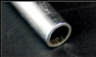
紫铜材质, 其结构令传热效率更高