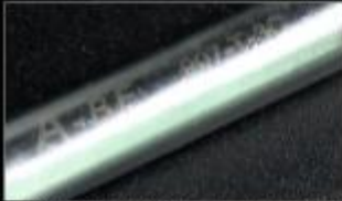
原装产品都有激光水印, 使用更放心