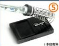
5.暂时不用可放到海绵烙铁架上