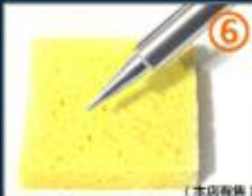
6.烙铁头上有杂质，在高温 海绵上清洗一下。