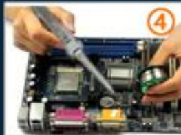
4.焊接（达到温度则可融化 焊锡丝，需另取焊锡丝）