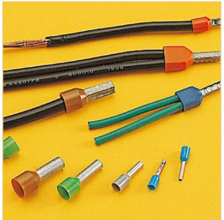
圆型绝缘和裸型欧式端子