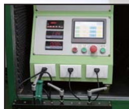
交流电气耐受与加速老化寿命测试