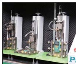
元器件寿命测试机