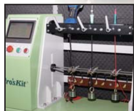
线路结合强度/疲劳测试