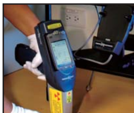
X光材质分析仪与 RoHS无铅测试