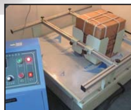
模拟运输振动试验机