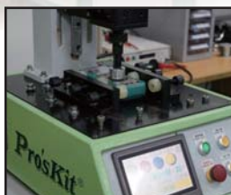
转盘/旋钮切换疲劳测试