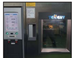
温湿度环境模拟测试系统