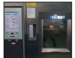
温湿度环境模拟测试系统