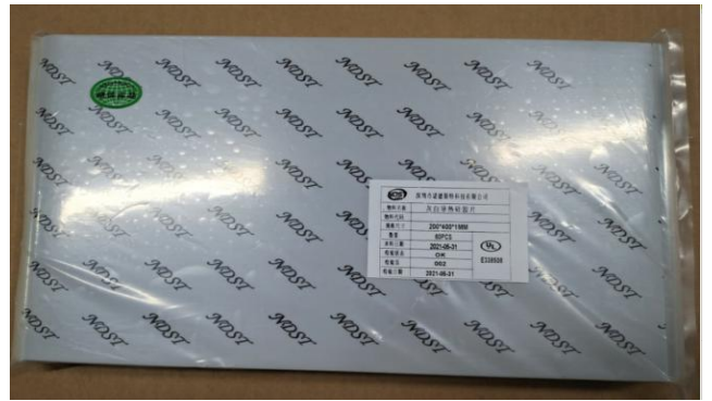
把产品装入 PE 胶袋, 并贴上内标签