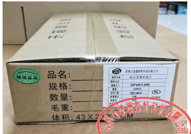
装箱, 并贴上外标签及 ROHS 标签后封箱