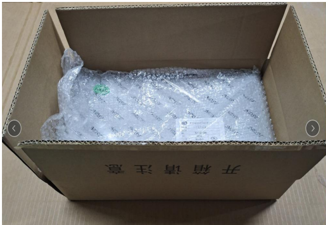
装贴好内标签的产品装入纸箱, 每箱 20PCS