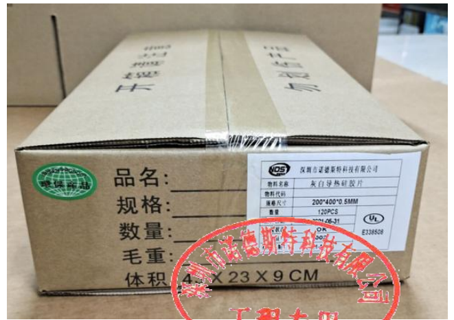
装箱, 并贴上外标签及 ROHS 标签后封箱