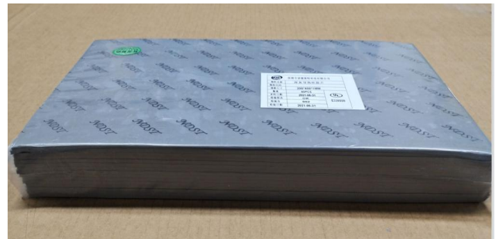
把产品装入 PE 胶袋, 并贴上内标签