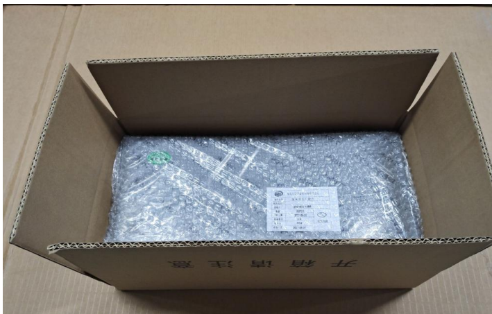
装贴好内标签的产品装入纸箱, 每箱 20PCS