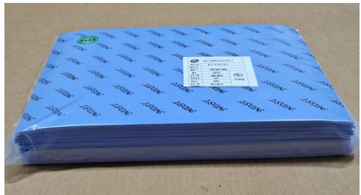
把产品装入 PE 胶袋, 并贴上内标签