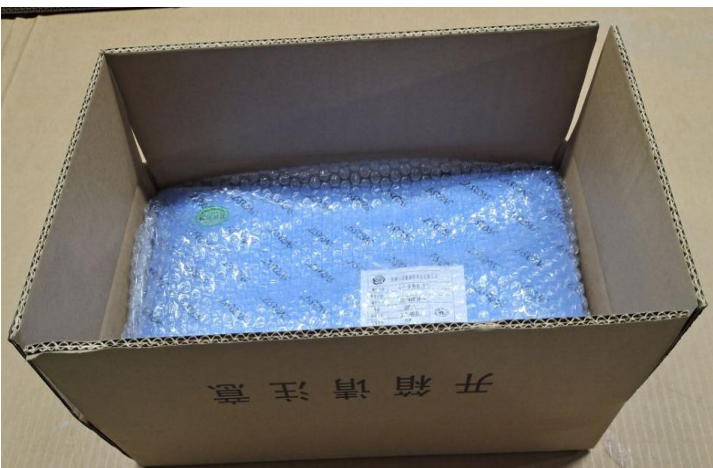
装贴好内标签的产品装入纸箱, 每箱 15PCS