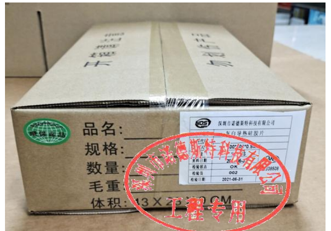
装箱, 并贴上外标签及 ROHS 标签后封箱