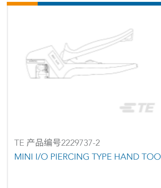
TE 产品编号2229737-2 MINI I/O PIERCING TYPE HAND TOOL