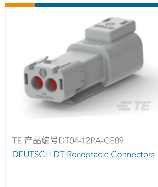
TE 产品编号DT04-12PA-CE09 DEUTSCH DT Receptacle Connectors