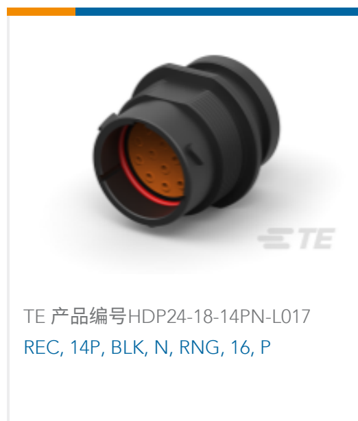
TE 产品编号HDP24-18-14PN-L017 REC, 14P, BLK, N, RNG, 16, P