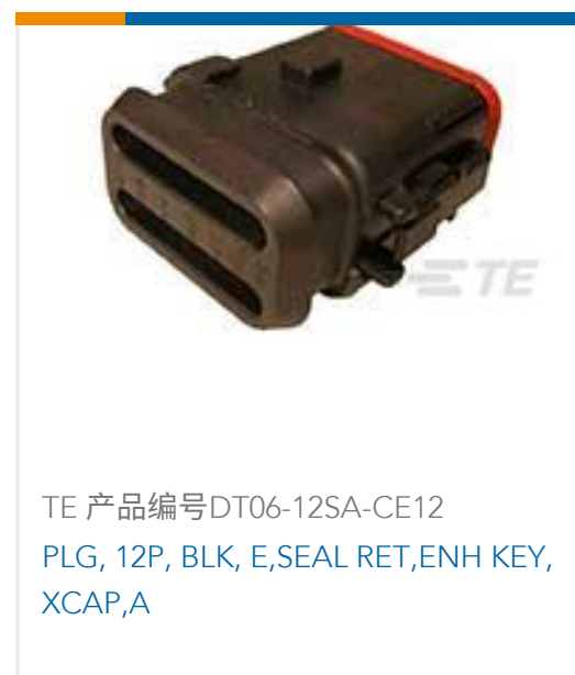
TE 产品编号DT06-12SA-CE12 PLG, 12P, BLK, E,SEAL RET,ENH KEY, XCAP,A