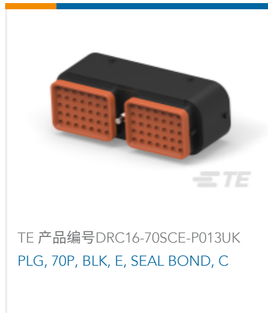
TE 产品编号DRC16-70SCE-P013UK PLG, 70P, BLK, E, SEAL BOND, C