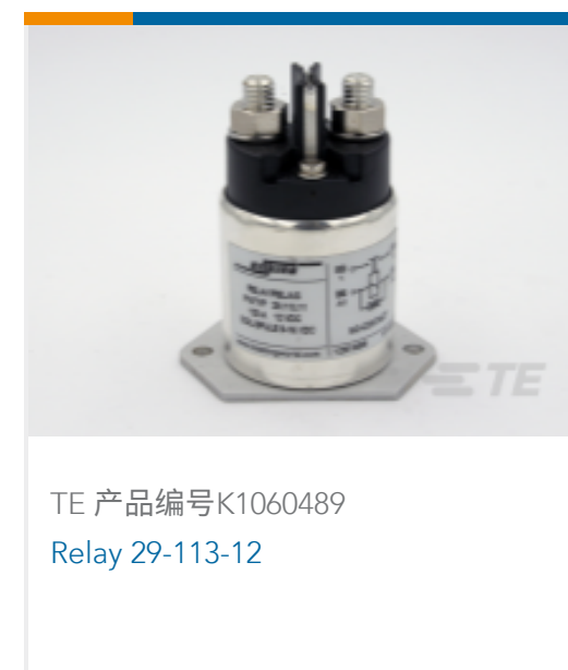
TE 产品编号K1060489 Relay 29-113-12