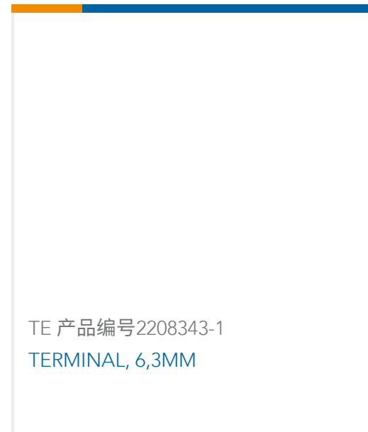
TE 产品编号2208343-1 TERMINAL, 6,3MM