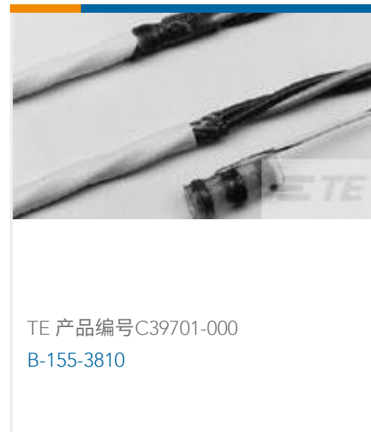
TE 产品编号C39701-000 B-155-3810