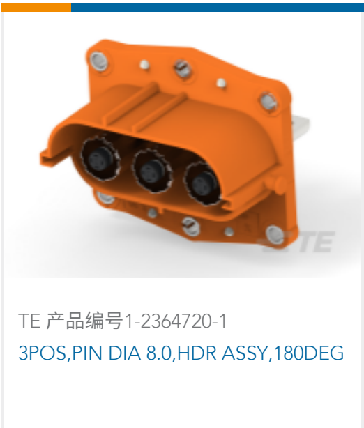
TE 产品编号1-2364720-1 3POS,PIN DIA 8.0,HDR ASSY,180DEG