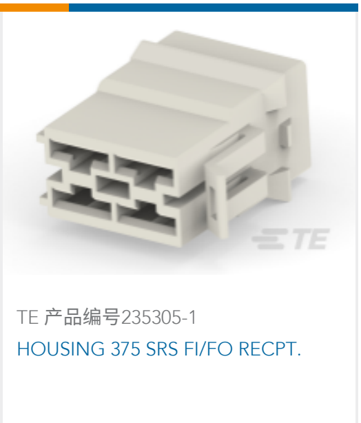
TE 产品编号235305-1 HOUSING 375 SRS FI/FO RECPT.