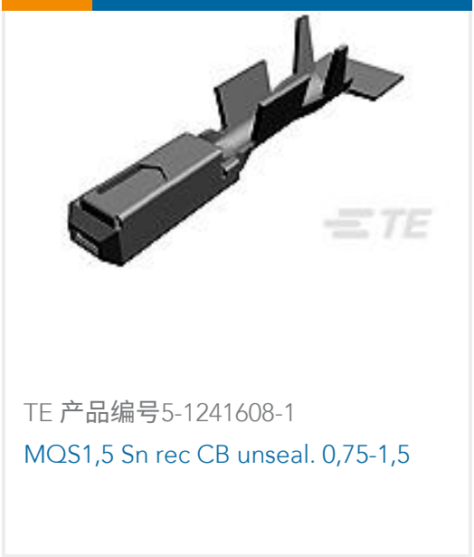
TE 产品编号5-1241608-1 MQS1,5 Sn rec CB unseal. 0,75-1,5