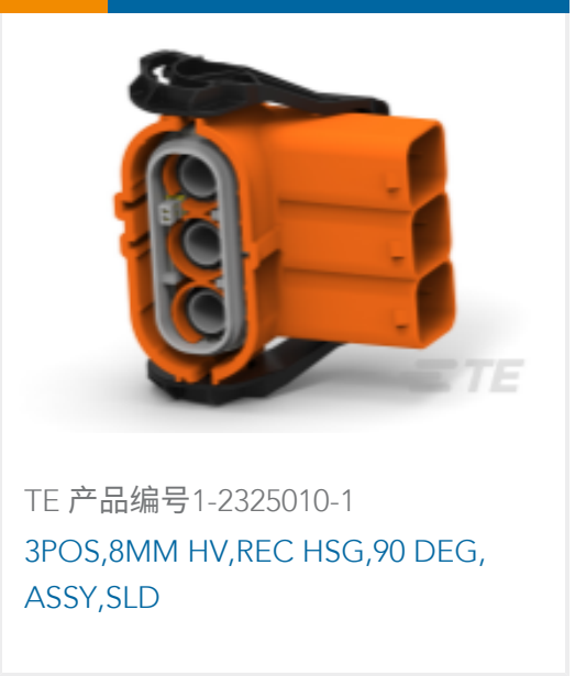
TE 产品编号1-2325010-1 3POS,8MM HV,REC HSG,90 DEG, ASSY,SLD