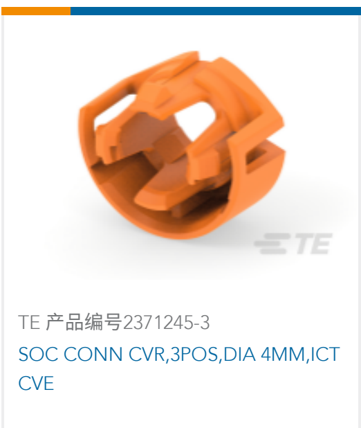
TE 产品编号2371245-3 SOC CONN CVR,3POS,DIA 4MM,ICT CVE