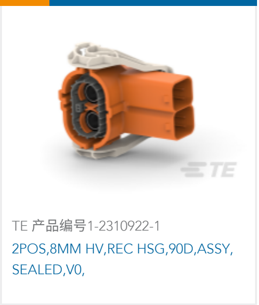
TE 产品编号1-2310922-1 2POS,8MM HV,REC HSG,90D,ASSY, SEALED,V0,