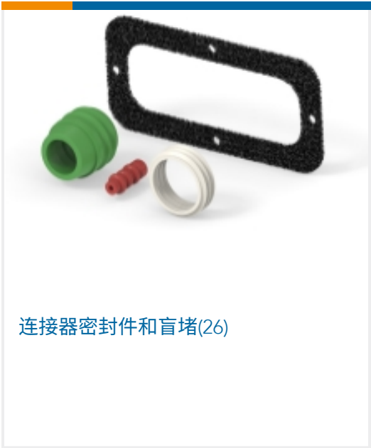
连接器密封件和盲堵(26)