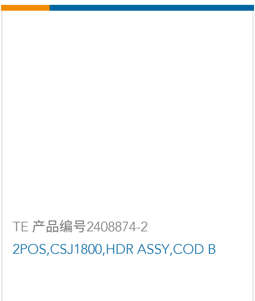
TE 产品编号2408874-2 2POS,CSJ1800,HDR ASSY,COD B