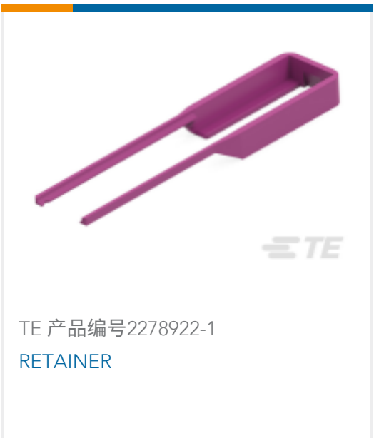
TE 产品编号2278922-1 RETAINER