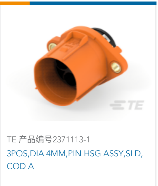
TE 产品编号2371113-1 3POS,DIA 4MM,PIN HSG ASSY,SLD, COD A