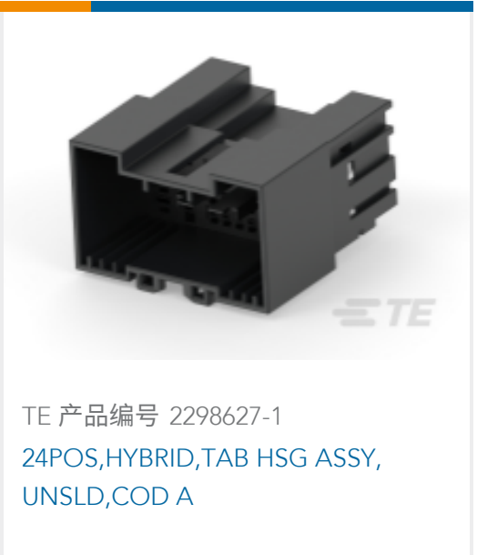
TE 产品编号 2298627-1 24POS,HYBRID,TAB HSG ASSY, UNSLD,COD A