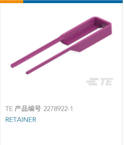
TE 产品编号 2278922-1 RETAINER