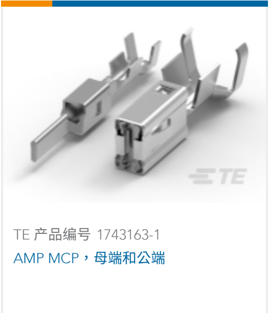
TE 产品编号 1743163-1 AMP MCP , 母端和公端