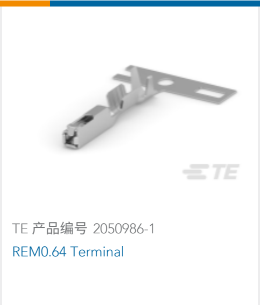
TE 产品编号 2050986-1 REM0.64 Terminal