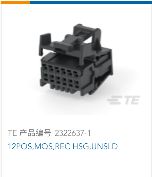
TE 产品编号 2322637-1 12POS,MQS,REC HSG,UNSLD