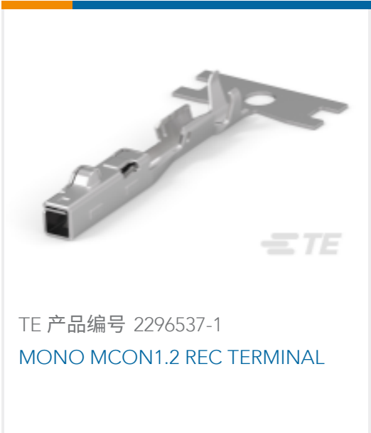
TE 产品编号 2296537-1 MONO MCON1.2 REC TERMINAL