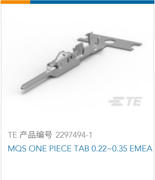
TE 产品编号 2297494-1 MQS ONE PIECE TAB 0.22~0.35 EMEA