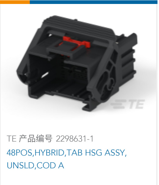
TE 产品编号 2298631-1 48POS,HYBRID,TAB HSG ASSY, UNSLD,COD A