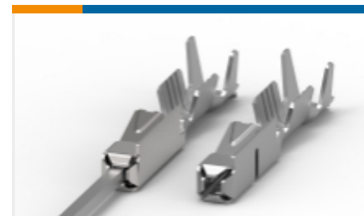
TE 产品编号968679-2 MQS, 母端和公端