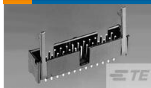
TE 产品编号2-1761609-6 IDC LOW PRO HDR 16P RA SHT LAT