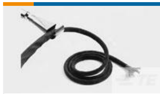
TE 产品编号CB7837-000 RW-200-3/16-0-SP