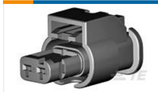
TE 产品编号1-1670916-1 2POS, MCON 1.2 LL REC SEALED