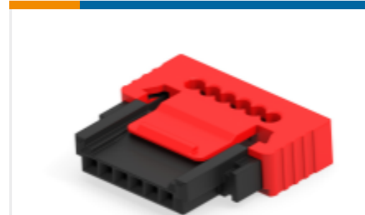
TE 产品编号474832-E SRCP 1,27 6 F 1-KS IDC22 137 E1 162 1,27