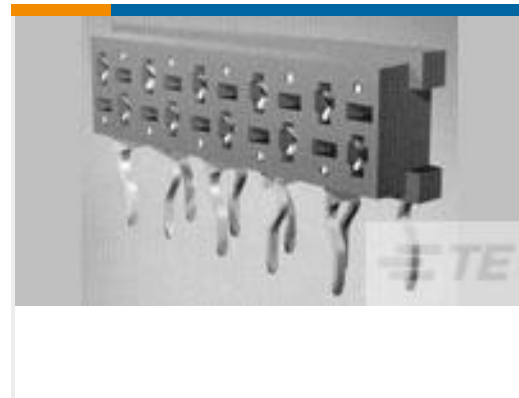
TE 产品编号 1-100400-0 MICRO-MATCH FSID NP