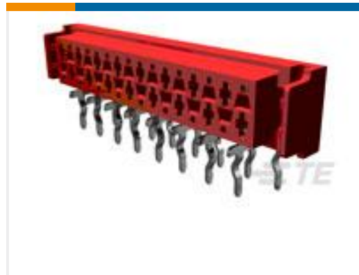
TE 产品编号 1-338070-0 MICRO-MATCH FEM.SE