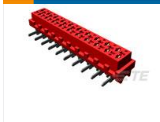
TE 产品编号 8-188431-0 M-MATCH FEM. BOTTOM ENTRY SMD INB.CONN.