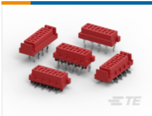
TE 产品编号 CAT-M5833-F3492A Female-on-Board Connector, Top Entry