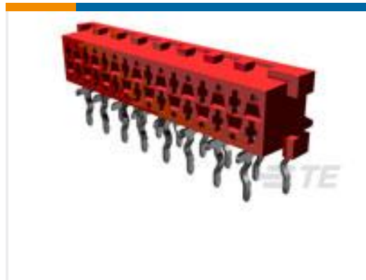
TE 产品编号 1-215460-0 MICRO-MATCH FEM.SE