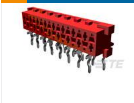
TE 产品编号 8-215460-0 MICRO-MATCH FSID P