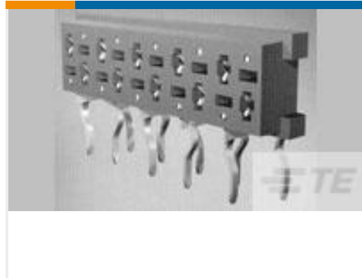
TE 产品编号 8-100400-0 MICRO-MATCH FSID NP