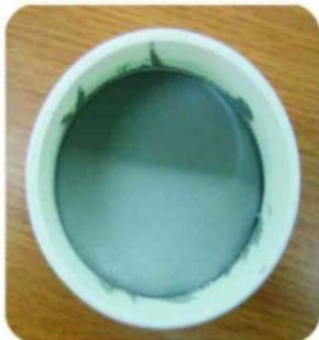
旋风运动方式不会使锡膏粘到上盖