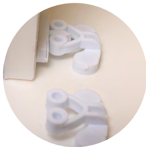
全塑料配件，提高耐腐蚀性