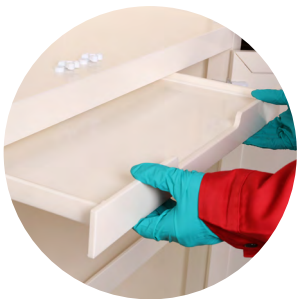
可存放 MSDS 文件或作为 临时操作台（仅 48 加仑）