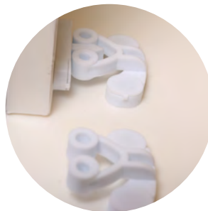
全塑料配件，提高耐腐蚀性