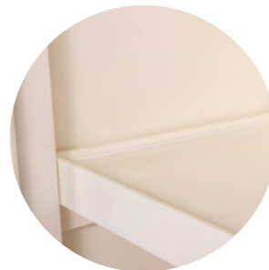
层板正反两用 依据盛漏量选择