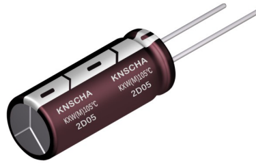
\phi D < 13\text{mm}