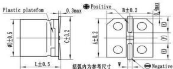
寸法图 图 1