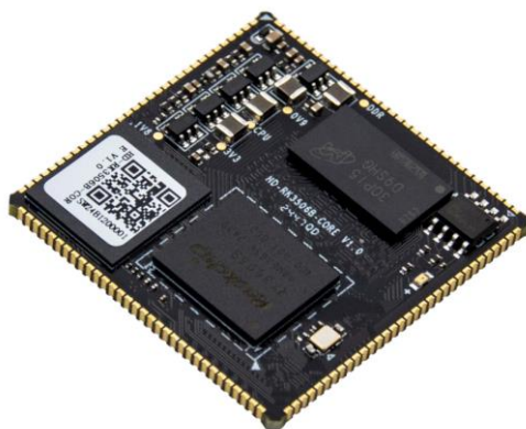
图 1 RK3506 核心板

HD-RK3506-CORE 核心板基于 Rockchip RK3506B/J 应用处理器开发，RK3506B/J 是一款高性能的三核 Cortex-A7 加单核 Cortex-M0 应用处理器。该处理器不仅内置了 2D 硬件引擎和显示输出引擎，还集成了丰富的外设接口，如 SAI、PDM、SPDIF、音频 ADC、USB2 OTG、RMII、CAN 等，可以满足不同的应用开发需求。RK3506 具有高性能的外置存储器接口（DDR3/DDR3L/DDR2），能够支持高要求的存储器带宽。